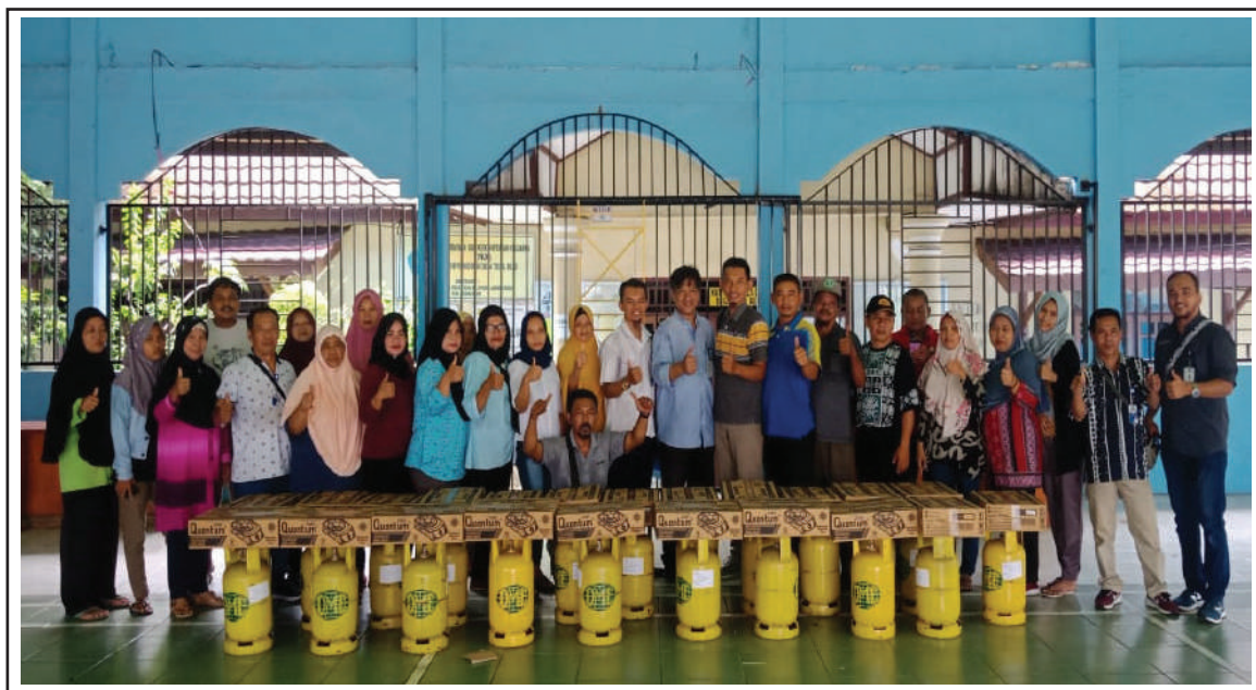
Gambar 2 Kegiatan sosialisasi dan penyerahan kompor DME kepada perwakilan warga Kelurahan Tegal Rejo, Tanjung Enim.

Selanjutnya perhitungan statistic dari hasil observasi pemakaian DME di sajikan pada Tabel 1 dan Tabel 2. Tabel 1 memperlihatkan hasil perhitungan statistik dari data hasil observasi konsumsi gas DME pada uji terap yang telah dilakukan terhadap